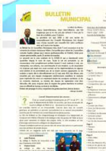
N°74 Sept 2020

Directeur de Publication : Olivier GUIOT, Maire