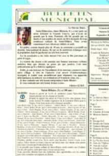
N°52 Sept 2014