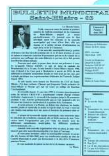
N°1 Juin 2001

Lecture vous accompagne encore pour un bon nombre d'années.